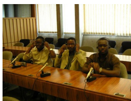
Des collègues d'Afrique francophone en visite à l'UNESCO lors du Stage technique international d'archives 2004.

L'UNESCO offre bien des ressources pour l'archiviste :